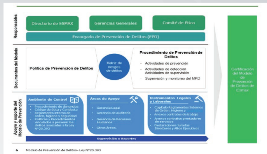
Figura 1: Representación gráfica de los componentes y áreas participantes del modelo.